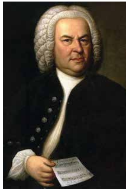
Johann Sebastian Bach (mit Rätselkanon)